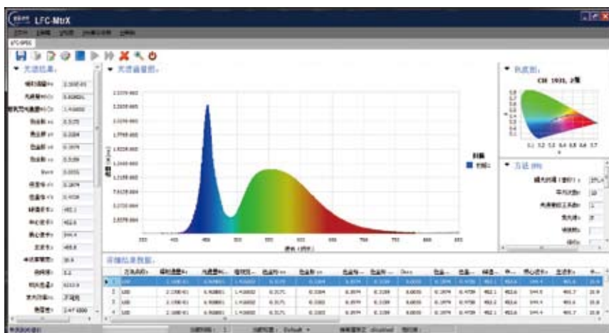
光测量软件 LFC-SPEC (中/英文)